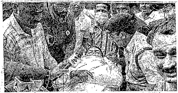
Patidar quota leader Hardik Patel is taken to a hospital from the site of his hunger-strike in Ahmedabad on Friday

Cha Redd in emp the deni are Cong As- rupt. Th an- gress al- take the As- ter be Praje Na En- his thra the 2ly